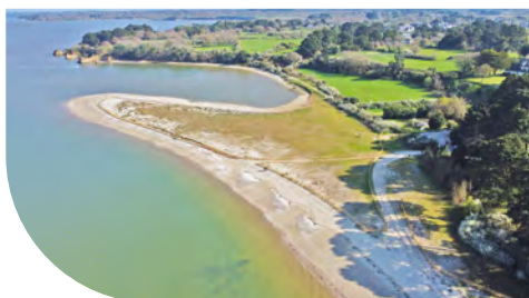
Reprise au club nautique