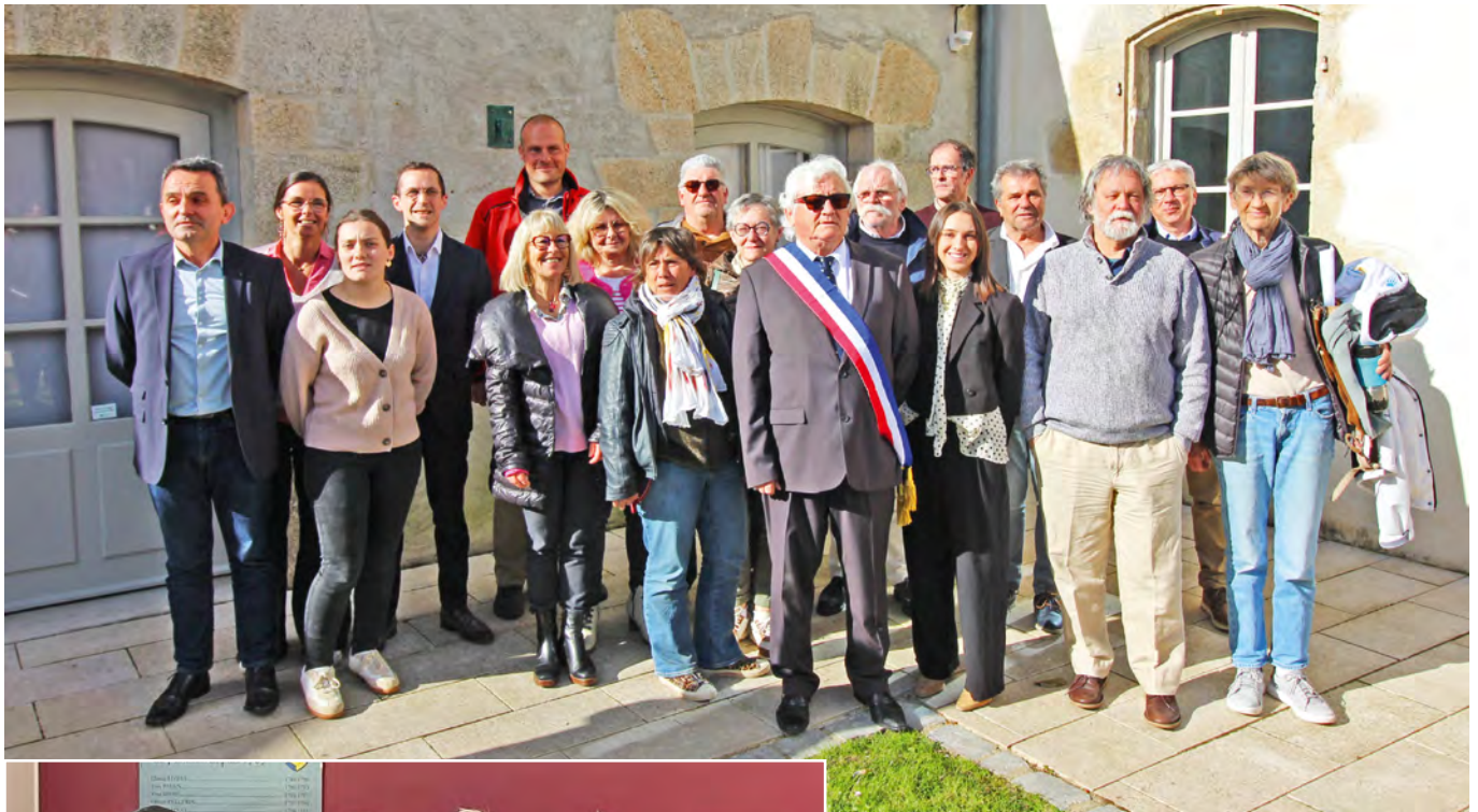
L'équipe municipale (presque) au complet