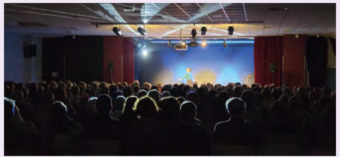
Béatrice de la Boulaye // Béatrice de la Boulaye, première tête d'affiche de la saison, a réuni 250 personnes le 17 janvier pour son seul en scène très apprécié du public