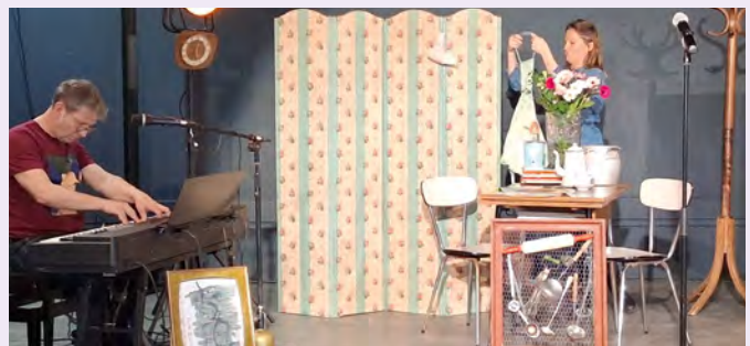
D'ames rebelles // 100 personnes pour le spectacle concert D'ames rebelles avec des chansons témoignant de l'émancipation de la femme le 7 mars.