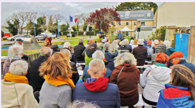
Le Printemps part en live // 29 mars