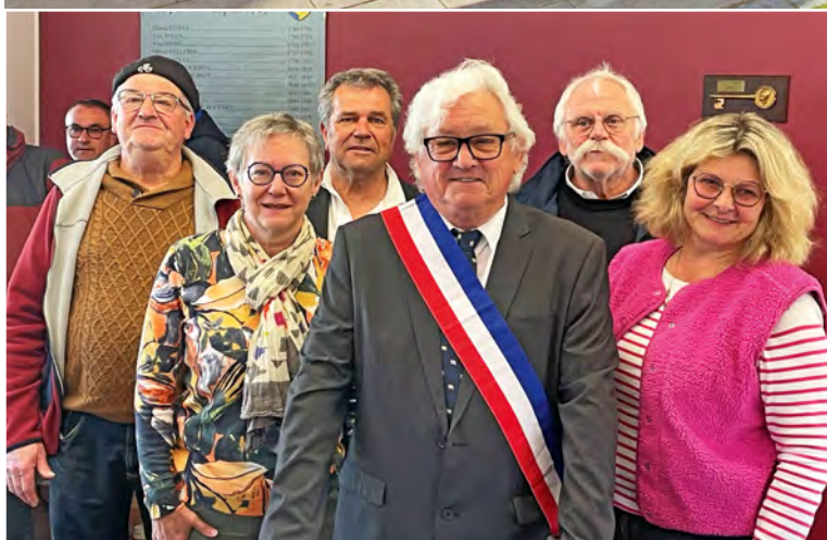
Le Maire entouré de ses 5 adjoints