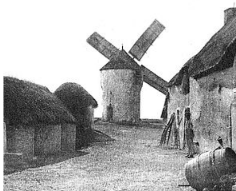
32 PÉNESTIN (Morbihan) - Le Moulin et la Villa "Ker Joyeux"

Ancien presbytère de la paroisse construit en 1769, les services administratifs de la mairie y sont logés depuis les années 1970. Des rajouts progressifs d'annexes au fur et à mesure des rénovations ont agrandi le bâtiment. 6. Les moulins Sept moulins à vent ont fonctionné jusqu'à la fin de la Seconde Guerre mondiale. Seuls deux existent encore aujourd'hui. Sous l'Ancien Régime, le seigneur confiait généralement à un meunier son moulin sous forme d'un bail. L'acte notarié du moulin du Clido datant de 1789 en est un exemple.