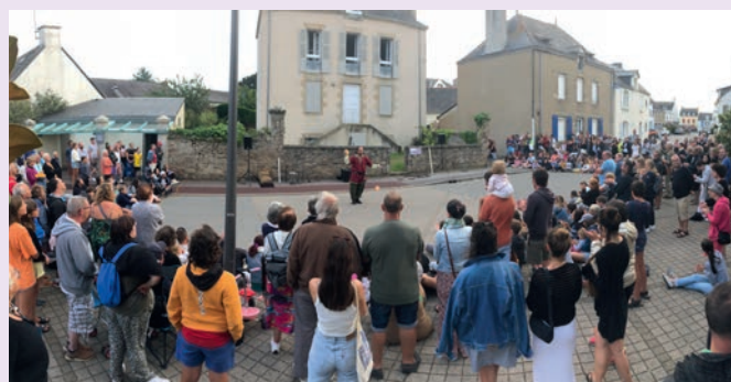
350 personnes en moyenne pour des spectacles de rue de qualité.