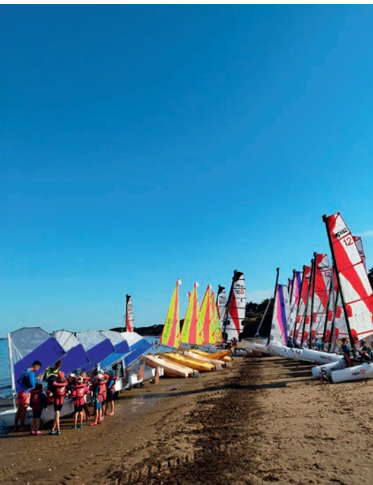
La flotte du CNP

Française de Randonnée. Après une belle saison 2022-2023 qui a réuni environ 80 pratiquants réguliers, la saison 2023-2024 s'annonce tout aussi prometteuse. Les cours sont encadrés par des animateurs bénévoles qui ont été formés à la pratique. Il y a actuellement 6 animateurs qui encadrent toute l'année des cours à La Poudrantais le mardi matin, mercredi matin, jeudi matin, samedi matin et samedi après-midi à La source avec des cours plus ciblés sur la pratique sportive et la compétition. Chaque cours peut accueillir 15 pratiquants.