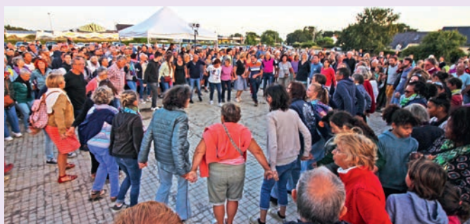
Autre tête d'affiche, Plantec a assuré le spectacle le 25 juillet en réunissant 1000 personnes dans Fest-Noz électro bouillonnant !