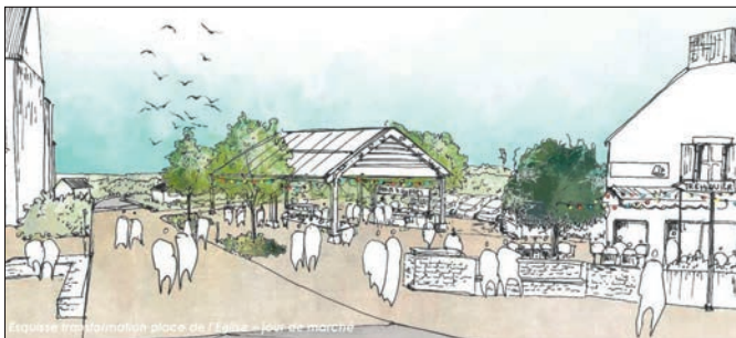
Place du marché