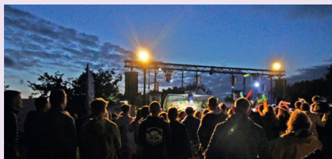
3 e édition du Summer Break à Pénestin avec 800 personnes présentes. Une valeur sûre.