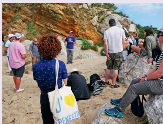
Environ 500 personnes ont pu découvrir l'histoire géologique de la Mine d'Or et du Palandrin cet été.