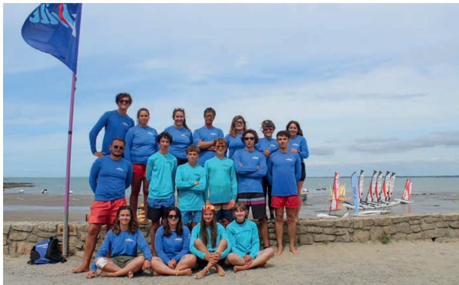
L'équipe du CNP

Les adhérents et salariés ont pris leurs marques dans la nouvelle structure du Club Nautique de Pénestin en ce début juillet. Un plaisir partagé par l'ensemble des usagers : la salle pédagogique permet d'accueillir les groupes au sec afin de développer leurs connaissances théoriques associées à la pratique de la voile, et les vestiaires, au nombre de quatre, permettent à chacun de se changer aisément.