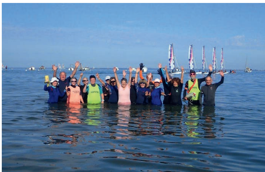
La marche aquatique a toujours autant de succès.

La Marche Aquatique Longe Côte se pratique toute l'année, elle est accueillie par le Club Nautique de Pénestin et l'activité dépend de la Fédération