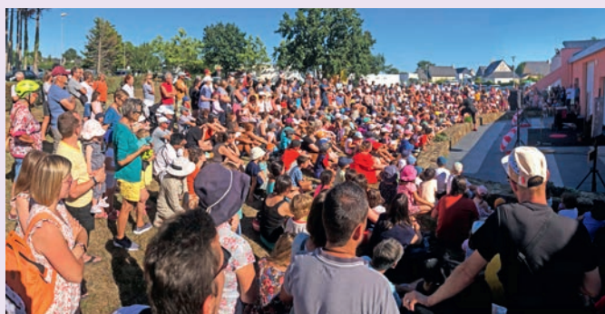
500 personnes en moyenne pour le rendez-vous Place aux Mômes du lundi soir.