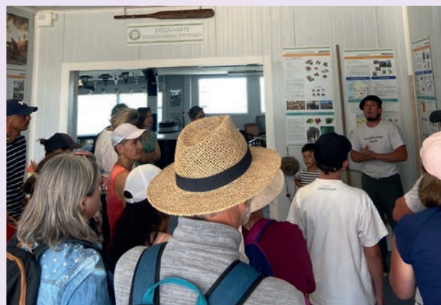
Les Journées de la Mytiliculture ont permis au public de visiter des chantiers mytilicoles Pénestinois. Merci aux entreprises Breizh Coquillages et Berbrazh d'avoir pris du temps pour faire découvrir leur métier.