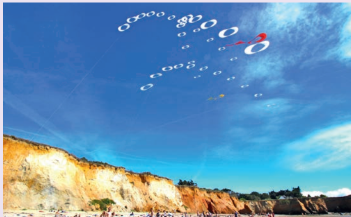
Les Envol de Pénestin ont à nouveau ravi le public présent cet été sur les plages Pénestinoises.