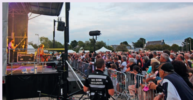
Tête d'affiche de cet été, le concert de Malo a accueilli le 16 août 1500 personnes, un record pour la commune.