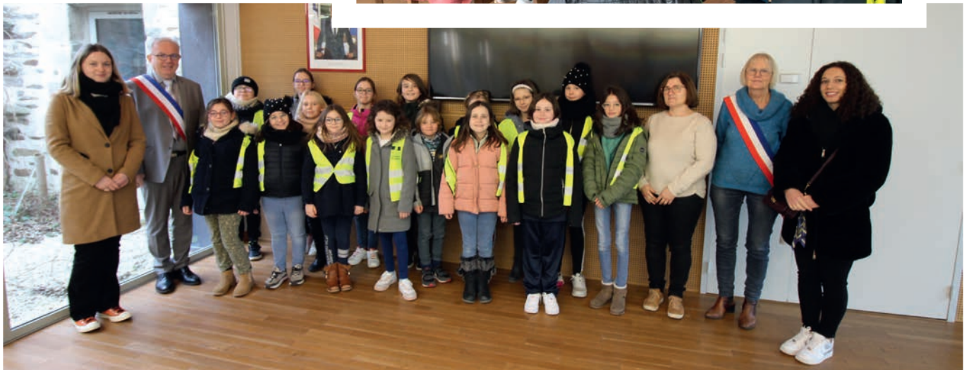
Les écoliers des écoles Laboureur et Saint-Gildas ont visité la mairie.